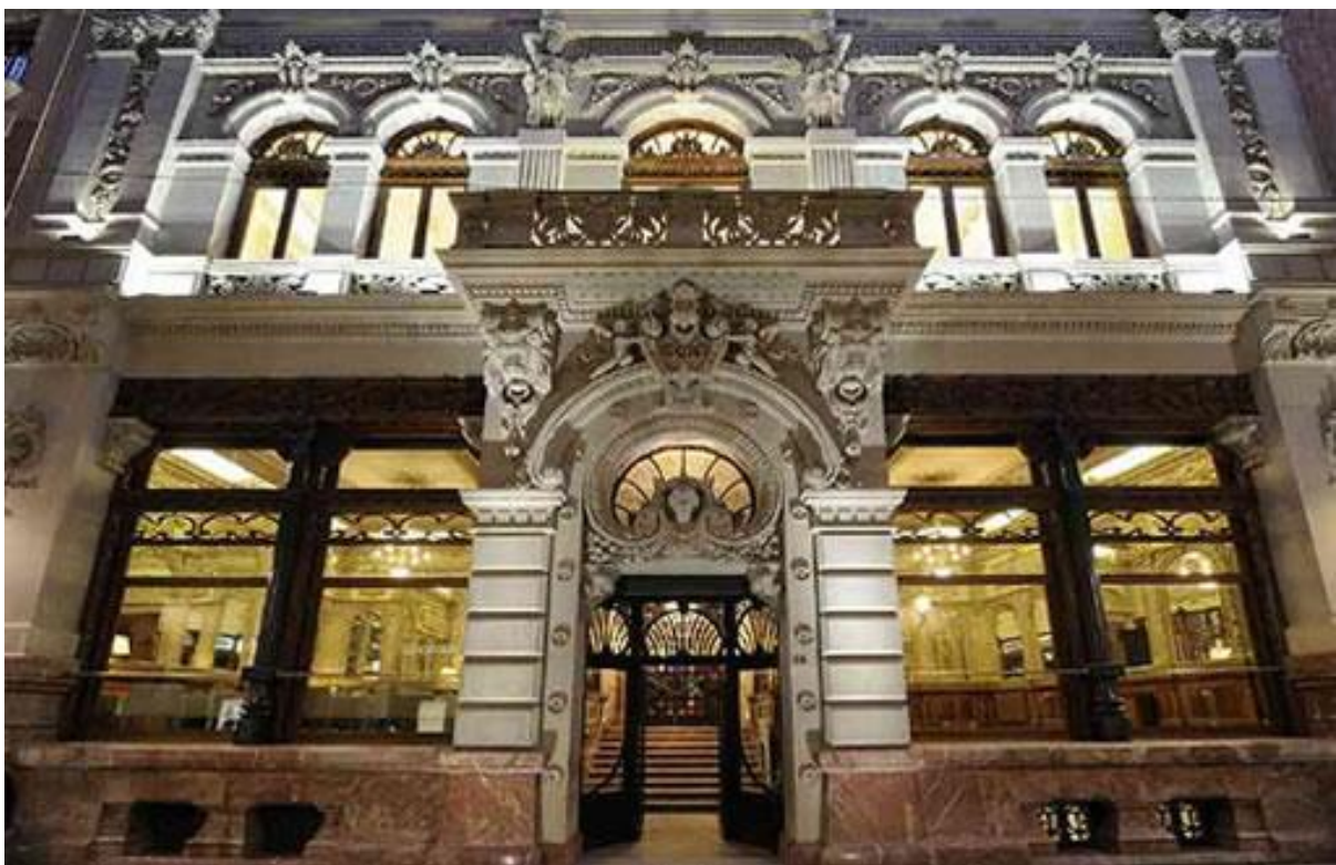
La facciata del Real Casinà

Esempi dell'eclettismo ottocentesco sono invece il già menzionato Real Casinò, il teatro Romea, la stazione Carmen, l'antico hotel Victoria e l'arena di La Condomina.