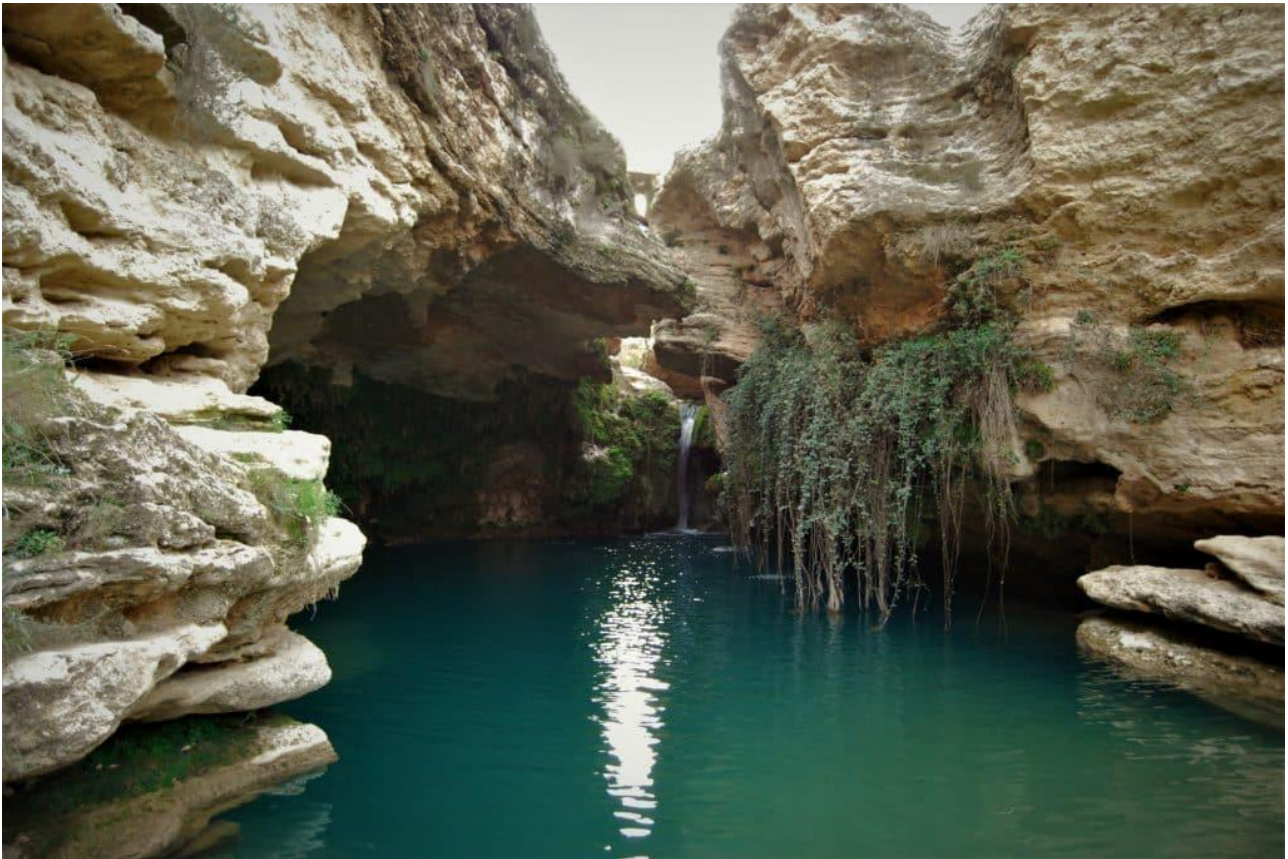
Il Salto del Usero

L'itinerario conduce ora nel territorio comunale di Bullas per visitare un sito naturale che attira ogni anno migliaia di turisti. Si sta parlando del Salto del Usero, una cascata formata dal fiume Mula, dove la notte di San Giovanni si celebra la “Bajada de la Mora”. Centinaia di persone, allo scoccare della mezzanotte, si radunano nei pressi della cascata con l'obiettivo di incontrare la "regina moresca" ed essere benedetti dalle sue acque miracolose.