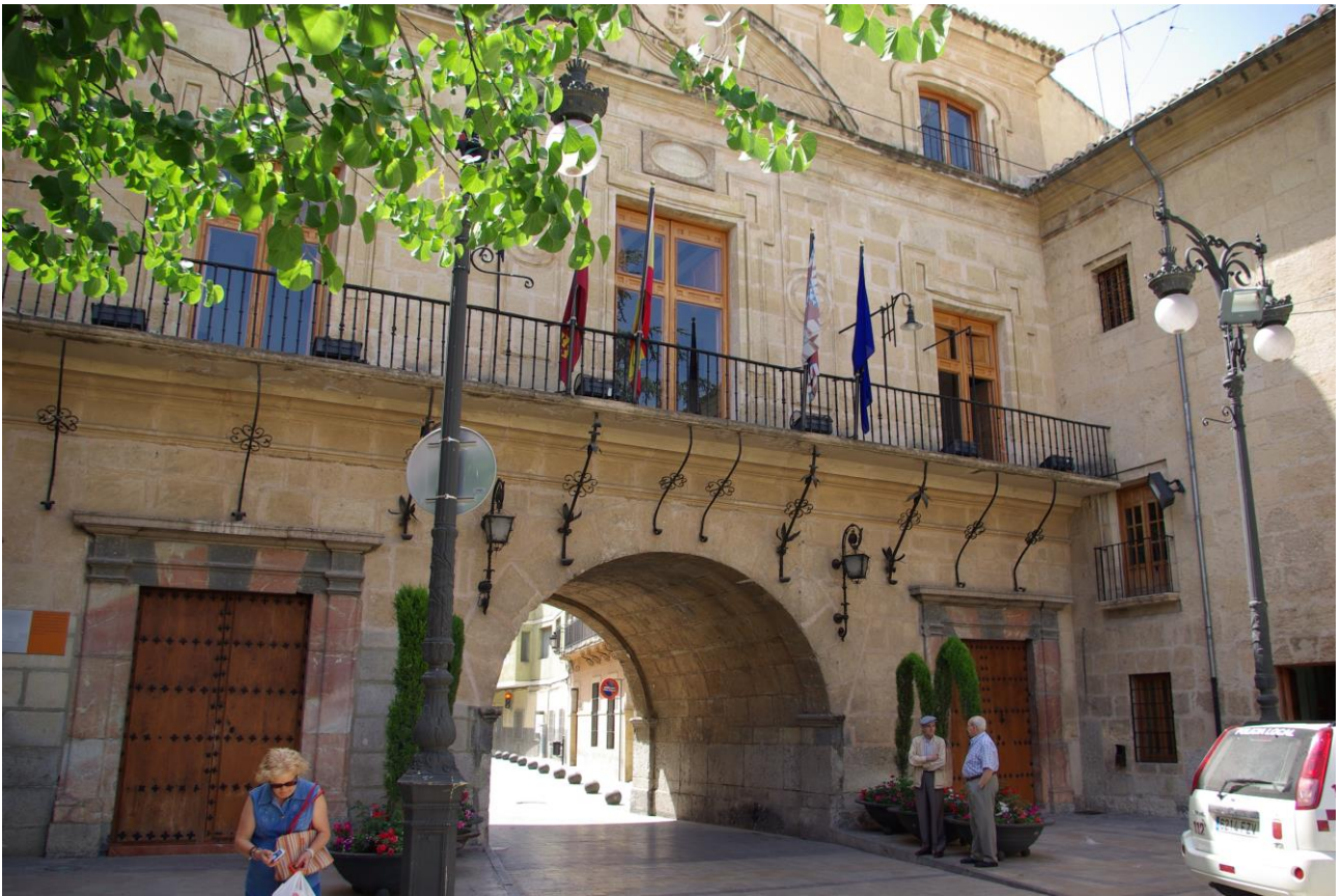
L'edificio comunale

Intorno alle vie Puentevilla, Mayor, De las Monjas, Rafael Tejeo, Gregorio Javier e alla Plaza de los Caballos del Vino si trovano numerosi palazzi nobiliari come Palacio de los Uribe del XVI secolo e Palacio de la Encomienda che risalgono all'epoca in cui Caravaca, dopo la riunificazione dell'Andalusia si espanse verso la pianura, non essendo più costretta all'interno delle mura di difesa.