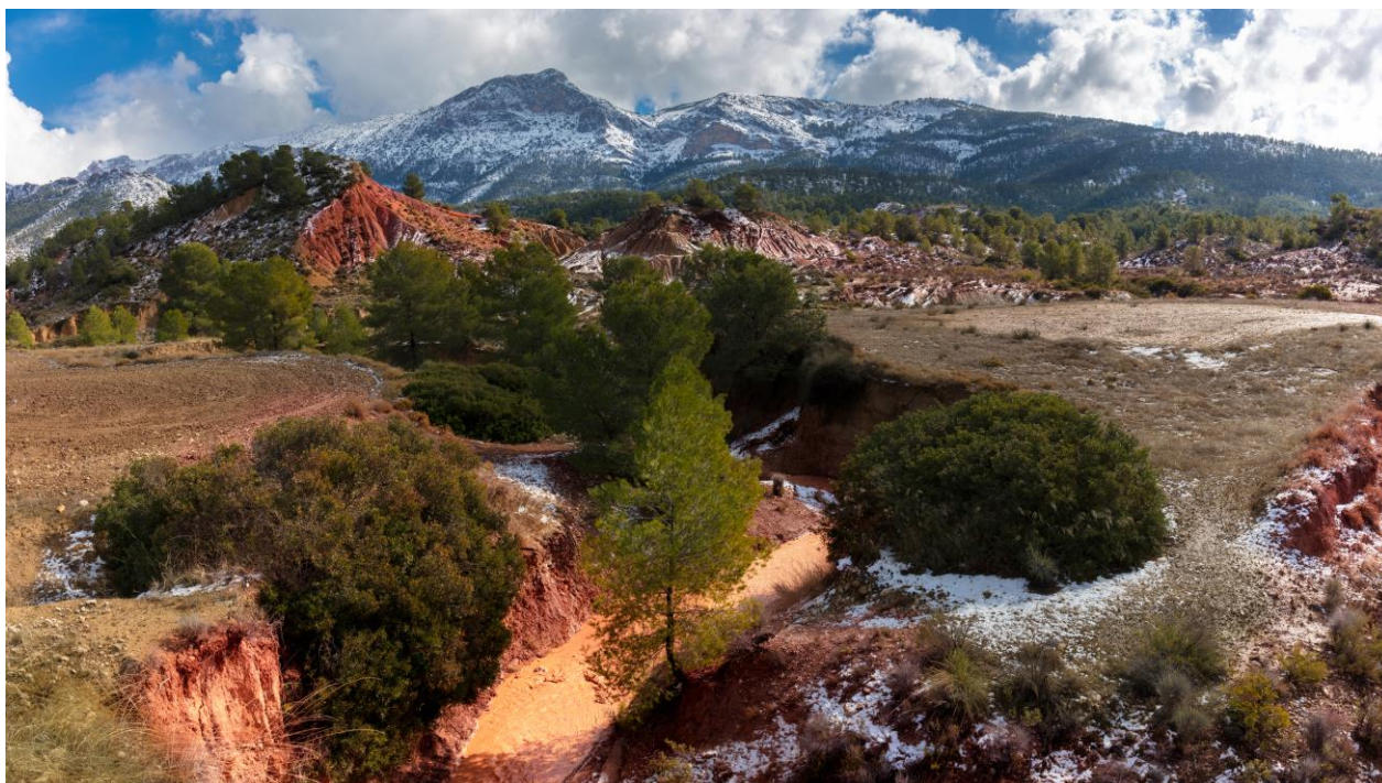
Particolare della Sierra Espuña

Coloro che dopo la visita di Murcia intendono ritagliarsi un po' di riposo, possono recarsi sulla Sierra Espuña, un massiccio montuoso che dista dal capoluogo meno di cinquanta chilometri. Al suo interno si trova il Parco Regionale creato nel 1991 ed un passaggio al centro visite fornirà le necessarie informazioni per una sosta interessante ed appagante.