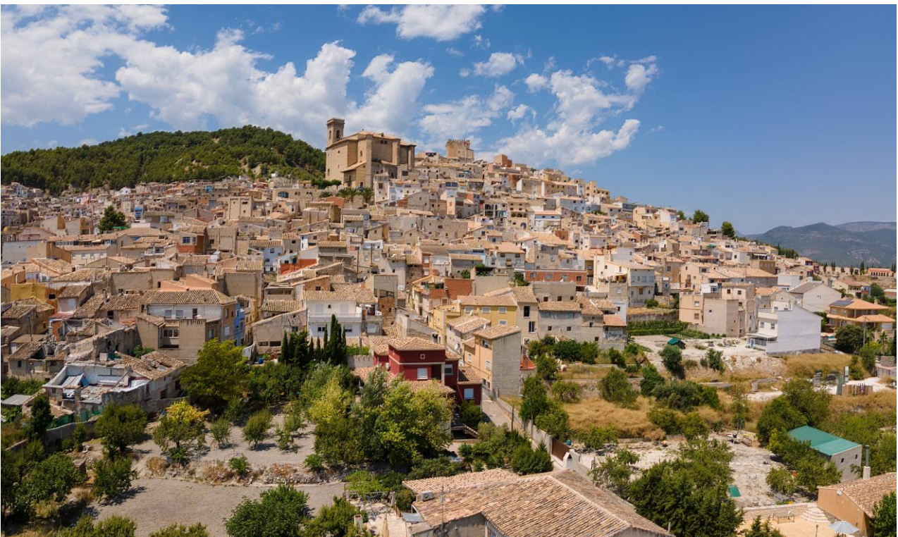
Veduta di Moratalla

Poco si sa del periodo che va dal tardo romano all'alto medioevo, salvo che in seguito passò, come tutto il resto del sud-est iberico, sotto la dominazione mussulmana sino al 1243, quando fu inclusa nel regno castigliano di Murcia.