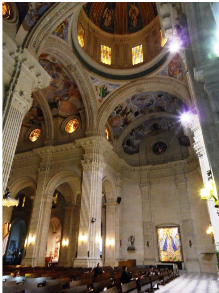
L'interno della basilica della Purisima

La Basilica della Purísima , la chiesa principale della città, fu costruita tra il 1775 e il 1868 secondo i canoni neoclassici. Ha una pianta a croce latina, con tre grandi navate separate da archi semicircolari, deambulatorio e cappelle tra i contrafforti. Sopra il transetto si erge una cupola il cui esterno è decorato a spirale con piastrelle smaltate bianche e blu. Le volte della navata centrale, del transetto e dell'abside sono affrescate con scene della Settimana Santa.