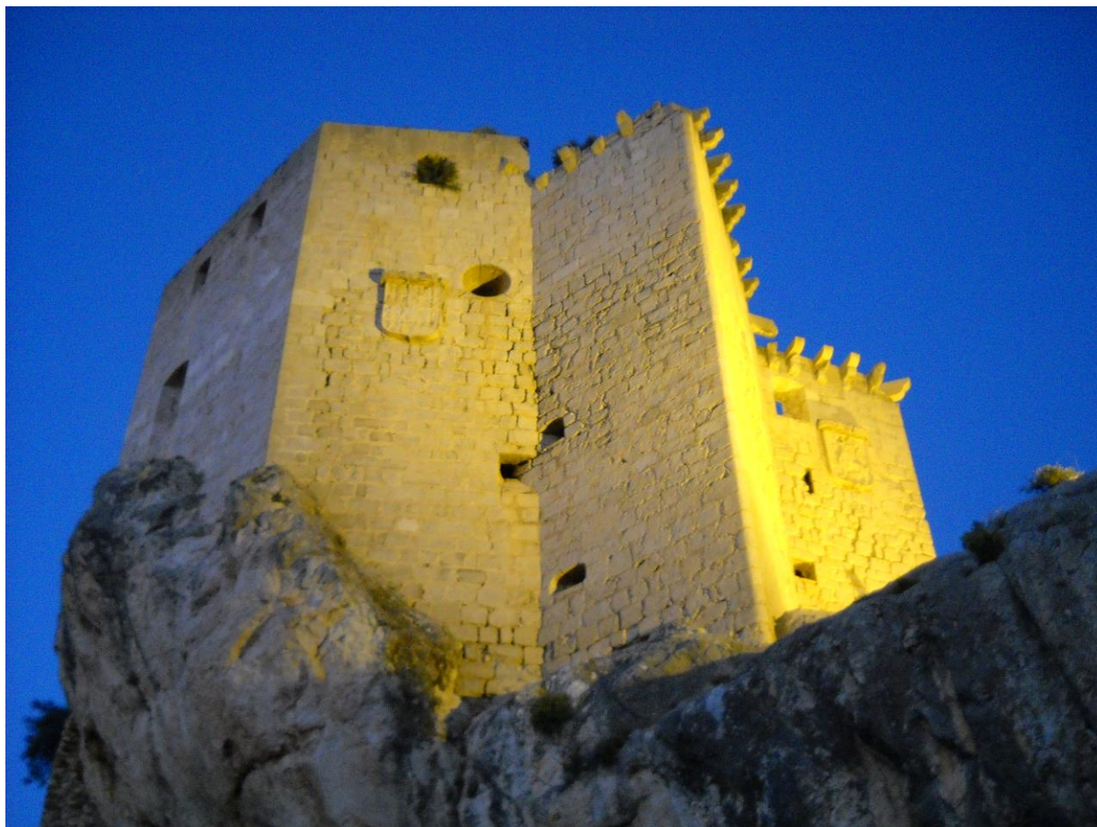
Il castello di Vélez - Crediti fotografici: Antonio

Costruita nel 1524 dal marchese di Vélez su di una preesistente fortezza araba, con lo scopo di garantire la sottomissione della città, possiede un'architettura rinascimentale, di forma molto semplice, tipica delle strutture a carattere difensivo.