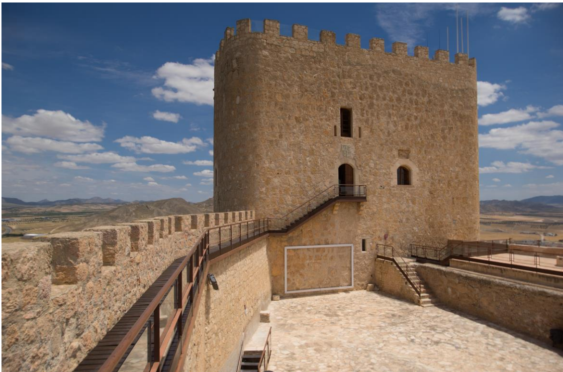
Il castello di Jumilla

Le prime fortificazioni infatti risalgono all'età del bronzo e, data la posizione strategica del luogo, continuarono ad essere rinforzate ed ampliate nel corso dei secoli. Nell'età del ferro vi si stabilirono gli Iberici che le trasformarono in una grande città fortificata. Successivamente i Romani ne presero possesso, fortificando ulteriormente il colle con la costruzione di parte della cinta muraria, che si conserva ancora oggi. Anche gli Arabi continuarono i lavori di fortificazione del luogo, finché, nel 1461 il marchese di Villena fece costruire la fortezza attuale.