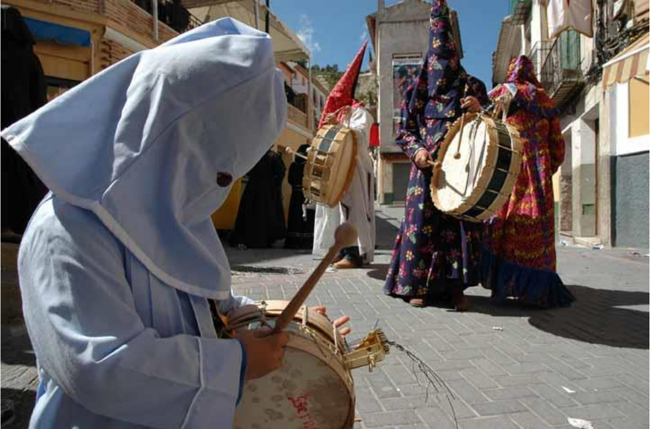
La tamborada de Moratalla - Crediti fotografici: Lomasplus

Questo secondo itinerario si svolge sempre nella provincia di Murcia ed ha una lunghezza di circa duecentoquaranta chilometri.