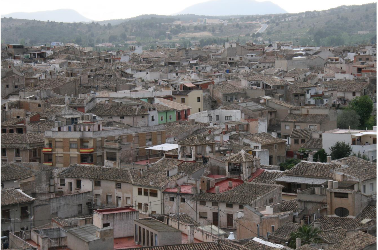
Il centro storico di Caravaca

Caravaca è anche ricca di musei che si riassumono nei seguenti: