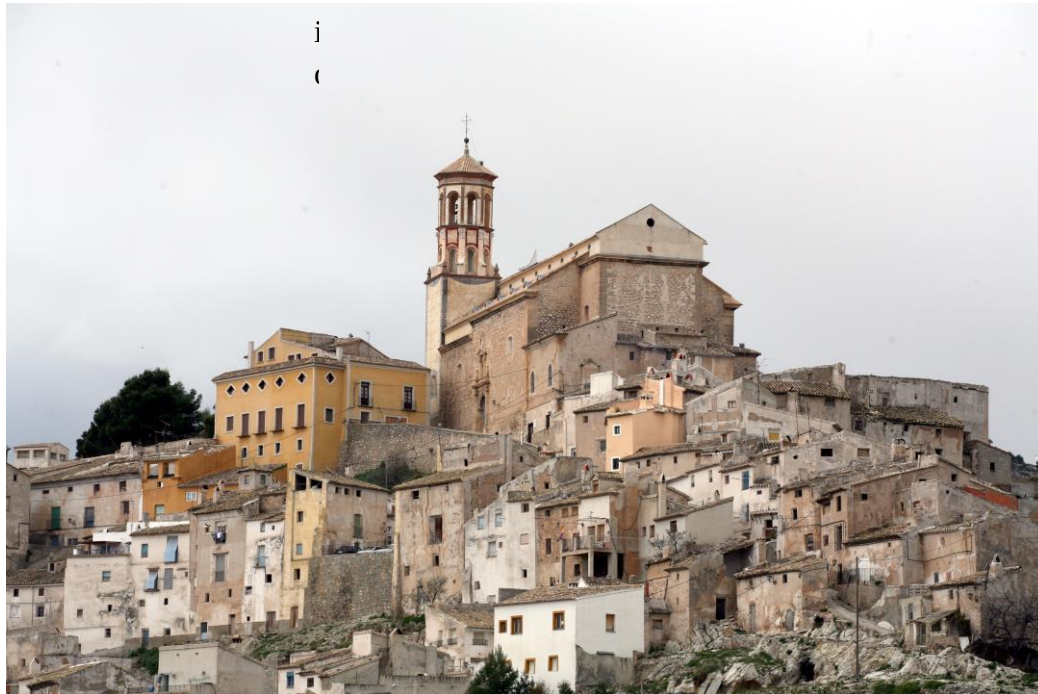
Il centro storico - Crediti fotografici: Claudia López Oñate

Il centro storico di Cehegin , dichiarato Complesso Storico – Artistico, è uno dei meglio conservati e più interessanti della regione murciana, per cui è gioco forza iniziare la visita del comune proprio dalla città vecchia e più precisamente da Plaza de la Constitución, luogo emblematico di incomparabile bellezza, che ospita alcuni edifici di pregio come l'antiguo Concejo, del XVII secolo e oggi museo archeologico, il Palacio de la Tercia. Del XVIII e la chiesa di Santa Maria Maddalena i cui lavori iniziarono nel XVI secolo, ma rimasero incompiuti sino alla fine del XVII. È l'edificio più notevole del patrimonio religioso di Cehegino e il più caratteristico, poiché attorno ad esso si è sviluppata tutta la città antica. I suoi lavori iniziarono nel XVI secolo e rimasero incompiuti fino alla fine del XVII. È stato dichiarato Bene di Interesse Culturale e Monumento Nazionale.