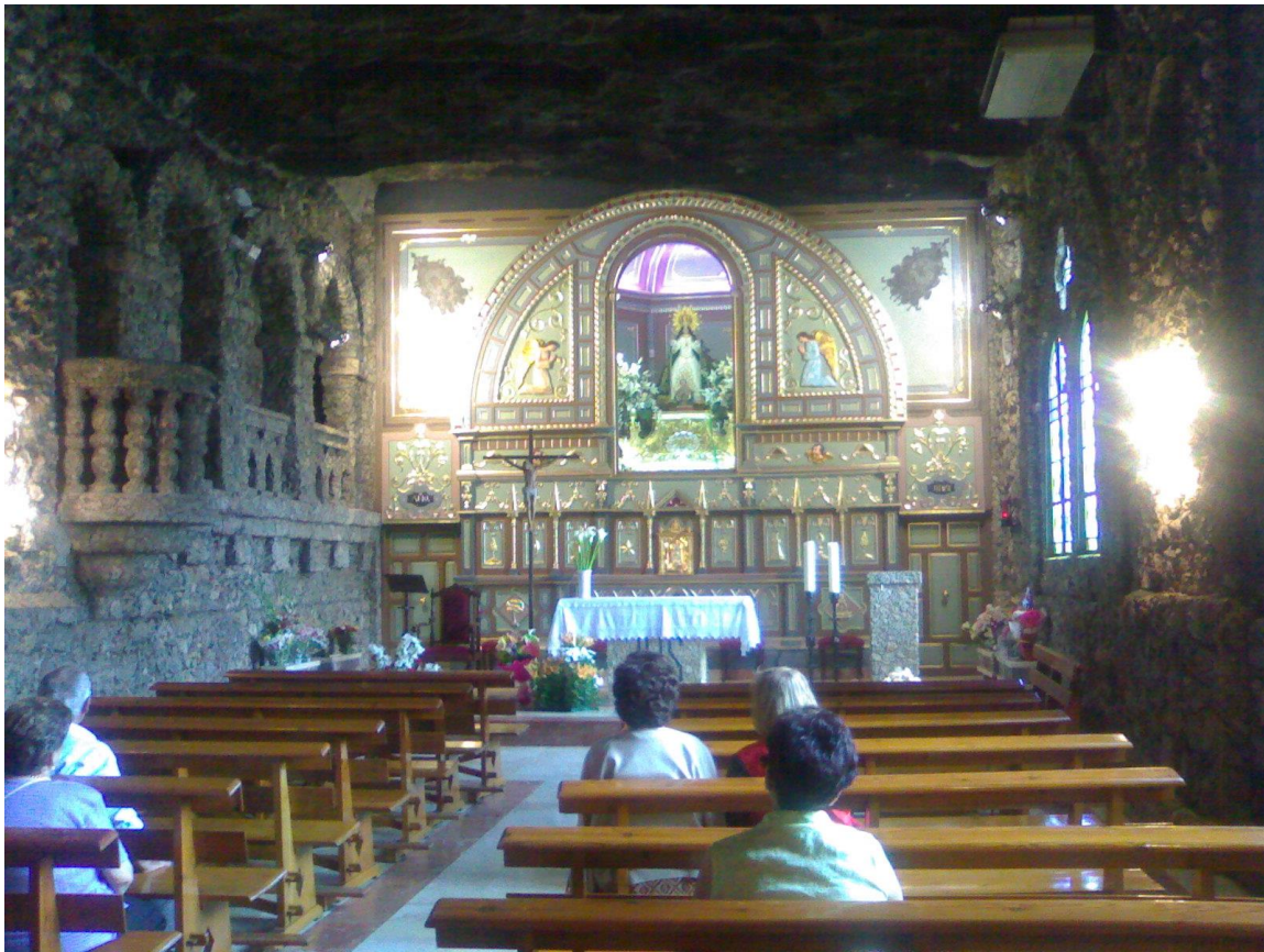
Interno del santuario

A pochi chilometri da Calasparra, in direzione sud – est , si trova il Canyon dell'Almadenes, un'area naturale protetta che si estende per due chilometri sul fiume Quipar e nove sul Segura, coprendo una superficie di centosedici ettari. Presenta in alcuni punti pareti verticali alte più di cento metri, prodottesi quando i fiumi sopracitati attraversano le catene montuose del Molino e del Palera attraverso fratture e faglie.