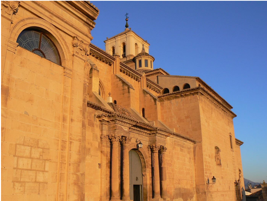
La chiesa di Santiago

La chiesa si caratterizza per la confluenza di diversi stili architettonici, a causa del lungo periodo di tempo in cui è avvenuta la sua costruzione, iniziata nel XV secolo e terminata nel XIX. Allo stesso modo, ci sono alcune peculiarità che la rendono così suggestiva esternamente, come l'esistenza di una cupola in stile rinascimentale che a sua volta si unisce al corpo gotico della navata principale o al campanile. E' Monumento Nazionale dal 1931.