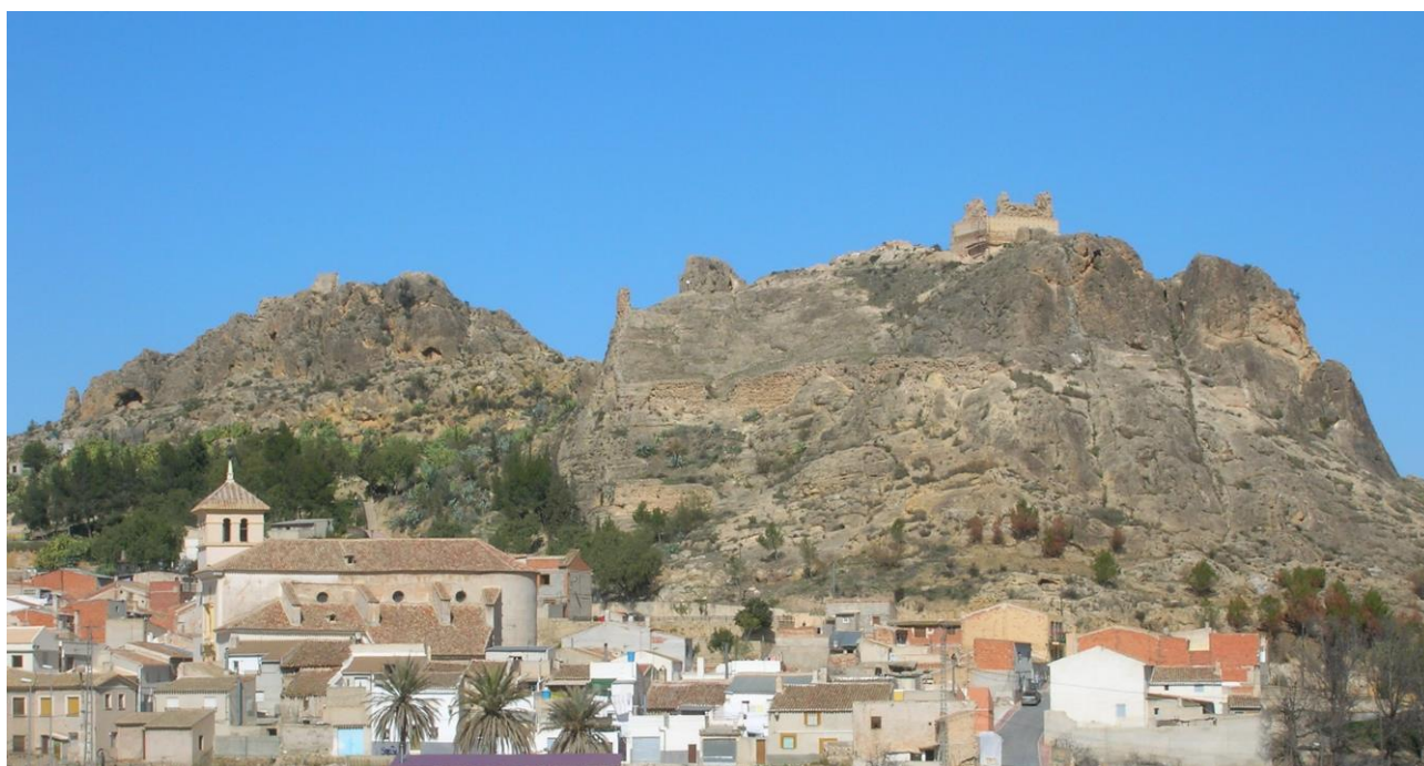
Vestigia del castello - Crediti fotografici: Autore sconosciuto

Tra i manufatti arabi che hanno permesso di creare teorie sulla presenza di questo popolo, il più importante è senza dubbio il castello di San Juan costruito nel XIII secolo. Si tratterebbe di un Hisn, termine che designerebbe un forte con doppia cinta muraria che all'occorrenza poteva ospitare una piccola popolazione.